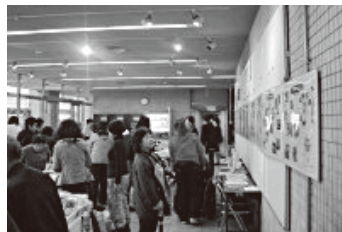
DV被害者支援バザー&パネル展

啓発の問題や、被害者の自立支援などが盛り込まれ、被害者支援にむけて一歩前進です!