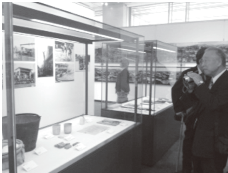
立派なケースに入れられた展示品

10月1日、岡山駅西口付近の岡山シティミュージアム内5階の一部に岡山空襲展示室がオープンしました。1996年「岡山市へいわかんの建設を求める会」結成以来16年間に