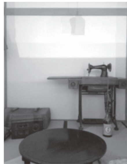
空襲当時の庶民の生活を再現

わたる市民運動がやっと実りました。1945年6月29日の米軍による岡山大空襲は2千人とも言われる命を奪いました。戦争の悲惨さと平和の大切さを次世代へ伝えようと被災者中心にへいわ館の設置を求めながら、2002年からNPOをたちあげ私設で空襲平和資料館を開設していましたがこの間公設の展示室が出来るに当たり展示品を寄付しました。今後もNPOの実績に学びながら平和教育の拠点になるよう市民と利用しながら拡充させていきましょう！